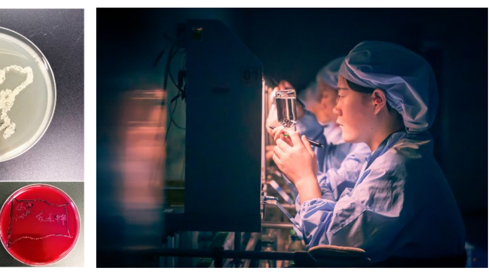
摄影二等奖:微生物下“我和我”